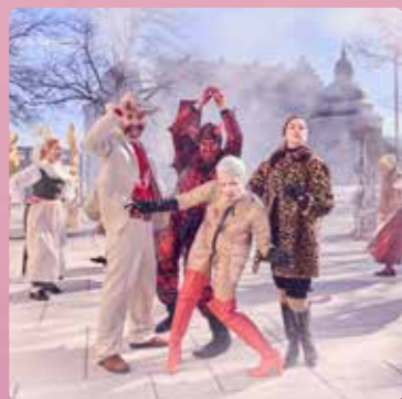
DEN GUDOMLIGA KOMEDIN